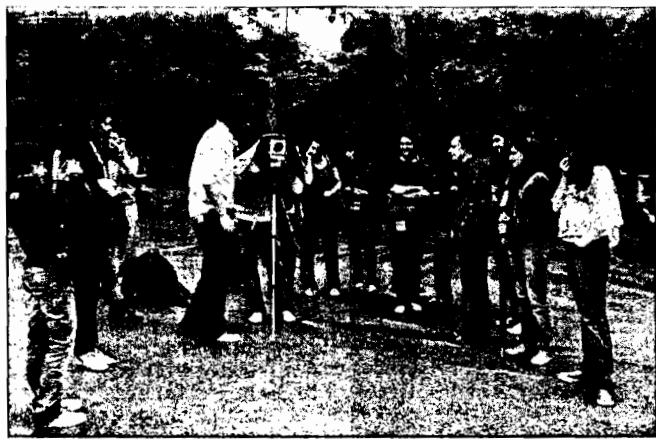
Un momento del workshop fotografico lungo il Rubicone

Savignano, concluso il programma triennale "Ipotesi di paesaggio"